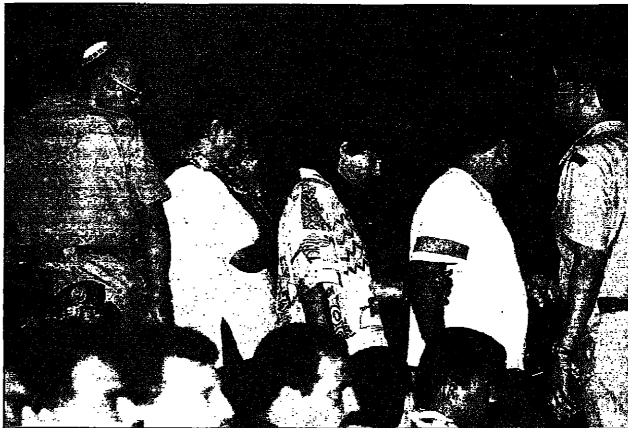
اسرائيليون يمسكون المحكمة العسكرية في عمان للدلاء بشهادتهم